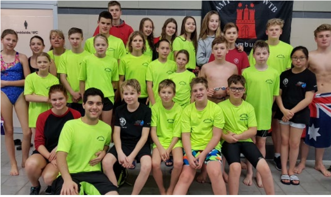
Teilnehmer und Trainer am 18.11.17

Um 10 Uhr begann dann der Wettkampf. Es nahmen 446 Schwimmer an den Hamburger Kurzbahnmeisterschaften teil, 46 Teilnehmer davon waren vom FTV-AMTV-WTB am Start.