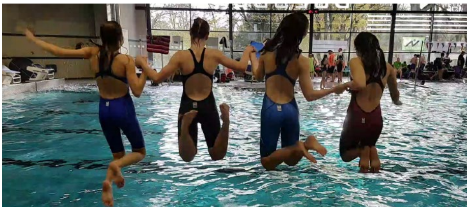
Oder um mal Unsinn zu machen...

Um 9 Uhr war an beiden Tagen offizieller Einlass und gleichzeitig wurde das Schwimmbecken zum Einschwimmen freigegeben. Das 50 Meter Becken wurde durch eine Brücke getrennt. Die eine Hälfte (25m) wurde für den Wettkampf genutzt und die andere Hälfte war während des gesamten Wochenendes zum Ein- und Ausschwimmen freigegeben.