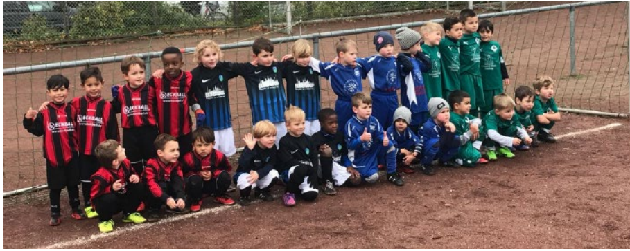
Gewinner des Turniers beim SC Urania, Freude pur, nur der FTV.