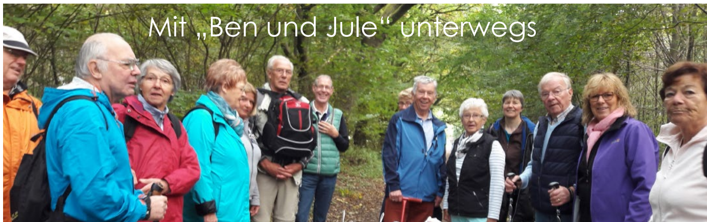
Wanderung 2017 der Skiabteilung

Am Sonnabend, dem 23. September, trafen sich gegen 9.45 die Wanderfreunde – 17 Personen, also nicht alle, die sich gemeldet hatten – am U-Bahnhof Farmsen, um den nächsten Zug in Richtung Buckhorn zu nehmen. Dort begann nun unsere Wanderung, bei der in der Mittagszeit ein Picknick vorgesehen war. Für diese Wanderung konnte ich einen Bollerwagen, der die Namen „Ben und Jule“ trug, organisieren, was sich als Vorteil herausstellte.