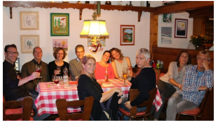
Auch unsere jüngeren Gäste hatten durchweg gute Laune.

So gegen 22:00 Uhr legte der Discjockey dann in seinem Computer die heißen Platten auf und es wurde viel getanzt. Das lag zum einen an der gut ausgesuchten Musikauswahl, zum anderen aber natürlich an der wirklich guten Stimmung von uns Gästen! Erst gegen 2:30 Uhr war die Party auch für die letzten Nachtschwärmer beendet, die dann mit dem Bewusstsein nach Hause gingen, dass dies ein gelungenes, fröhliches Fest war! Eine Wiederholung 2018 wäre sehr wünschenswert,