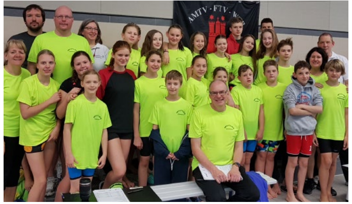
Teilnehmer, Trainer, Betreuer und Kampfrichter am 19.11.17

Um 10 Uhr begann dann der Wettkampf. Es nahmen 446 Schwimmer an den Hamburger Kurzbahnmeisterschaften teil, 46 Teilnehmer davon waren vom FTV-AMTV-WTB am Start.