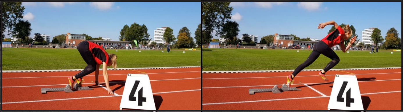
Auf die Plätze...fertig...Los...Lysann bereitet sich auf ihren 300m Start vor.