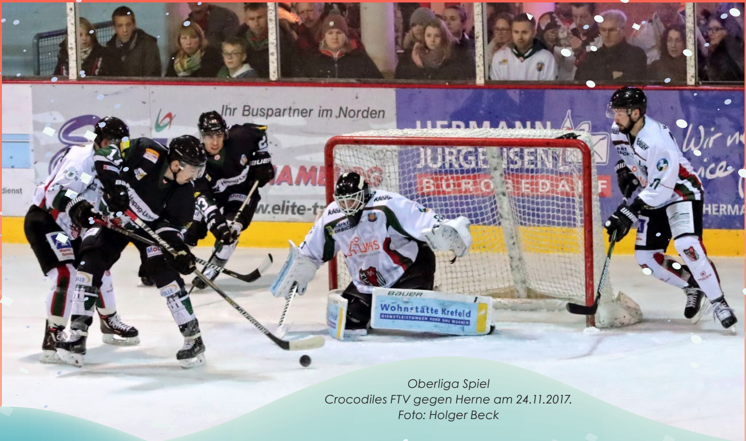
Oberliga Spiel Crocodiles FTV gegen Herne am 24.11.2017.