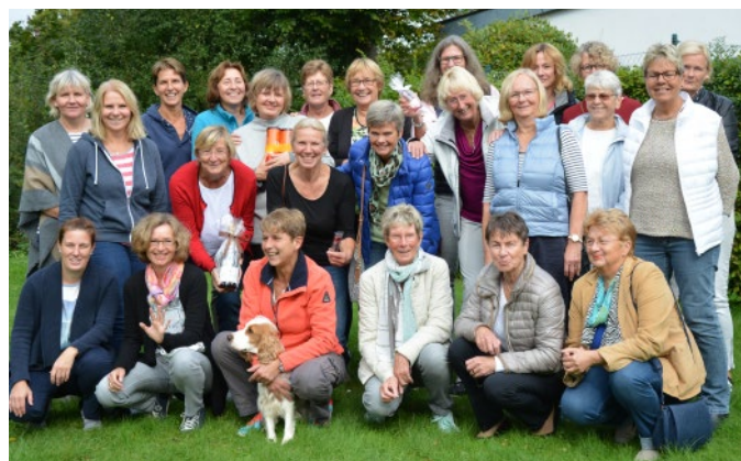
24 gut gelaunte FTV-Damen versammelten sich zu einem „Just for Fun“-Doppel-Turnier.

Am 24. September versammelten sich 24 gut gelaunte Damen ‚Vierzig Plus‘ zu einem „Just for Fun“-Doppel-Turnier auf der Farmsener Tennisanlage. In drei ausgelosten, bunt gemischten Runden konnten sowohl bekannte als auch nie da gewesene Doppel-Konstellationen erprobt werden. Köstliche selbstgebackene Kuchen vom Organisationsteam und Fabios italienische Kaffeespezialitäten trugen in den Spielpausen zur guten Stimmung trotz bescheidener Temperaturen bei.