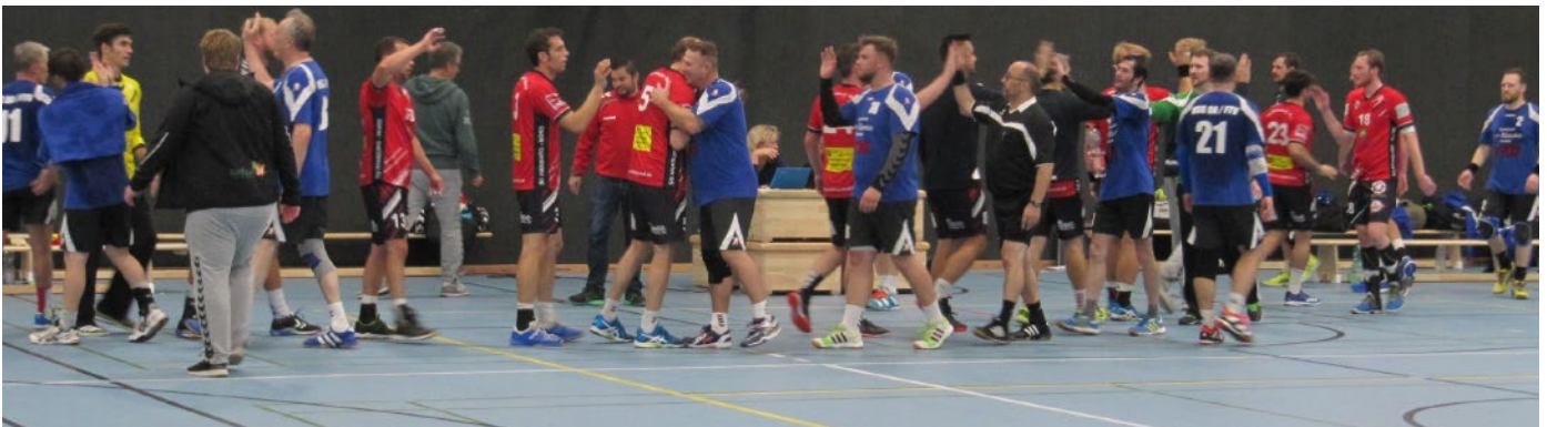
Faires Abklatschen zum Schluss.