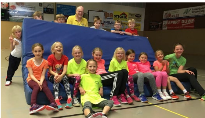
Unsere „Kleineren“ in der Sporthalle.

Am Abend waren wir dann immer fix und foxi und waren