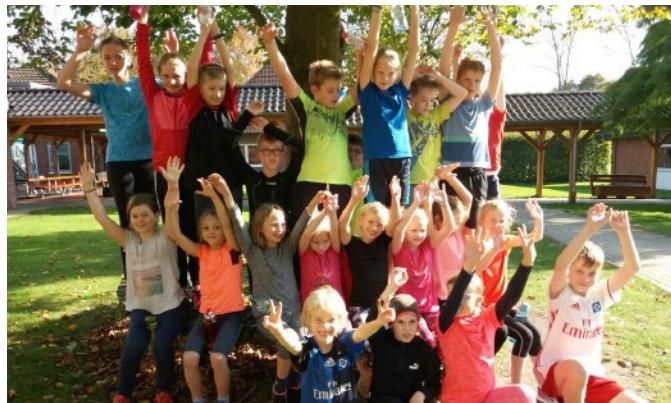
Vor dem ersten Sport ein Gruppenfoto aller Teilnehmer in der Sonne.

Das Training war nicht nur anstrengend, wir hatten auch viel Spaß miteinander.