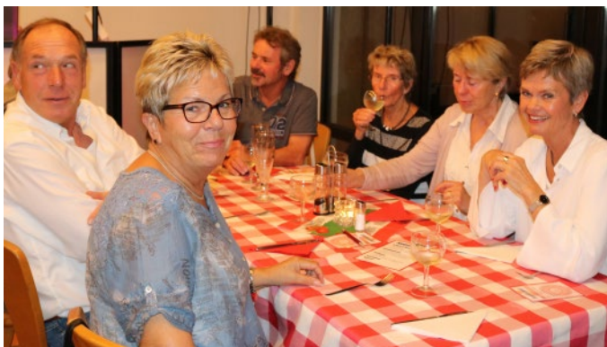
Allenthalben herrschte unter den Gästen eine fröhliche Stimmung.