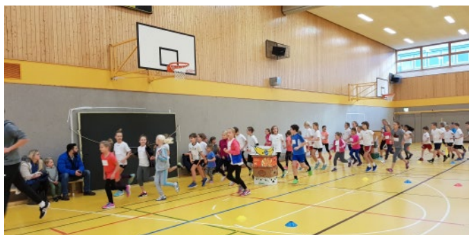
Gemeinsames Aufwärmen für 54 jüngste Athletinnen und Athleten.

Traditionell ging es für unsere jüngsten Athletinnen und Athleten des FTVs zum alljährlichen LAV Hamburg Nord internen Kinder-Vierkampf, bei dem sich alle Jung-Athletinnen und Athleten unserer 4 Vereine TUS Berne, Meiendorfer SV,