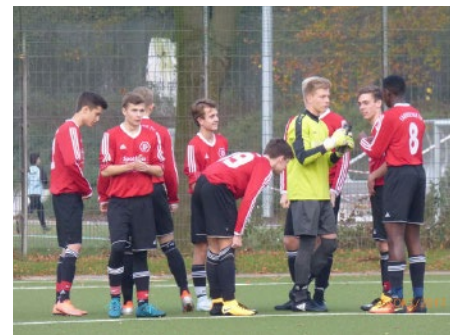
Kurze Pause, bald geht's weiter!

Voller Vorfriede warten wir nun nicht nur auf die Weihnachtszeit, sondern auch darauf, dass es endlich wieder losgeht!