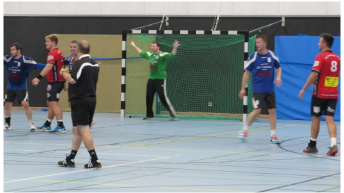
Jeder hat seinen Mann.

Am Ende setzten sich dann bei den Damen als 1. Harburg, 2. Hohenhorst und 3. Berlin, und bei den Herren 1. ETV, 2. Bargteheide und 3. Pankow Berlin durch. Die OA/FTV Teams schnitten jeweils als 4. ab. OK – eigentlich als Dritte, aber als gute Gastgeber und bei Punktegleichheit haben wir dann mal den Gästen den Vortritt gelassen.